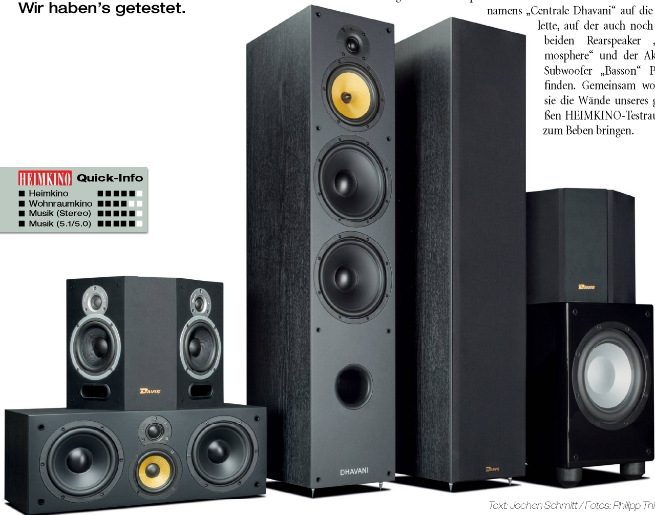
Text: Jochen Schmitt